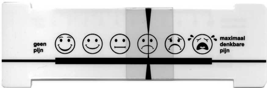
Afbeelding 1: voorkant pijnmeetlat

Veel mensen vinden het moeilijk om aan een ander uit te leggen hoeveel pijn zij hebben en dit uit te drukken in een cijfer. Als hulpmiddel hierbij kan een pijnmeetlat worden gebruikt. Hieronder ziet u een voorbeeld van een pijnmeetlat.