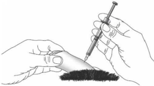
Afbeelding: injectie in de penis

U pakt de penis zo dicht mogelijk bij de buikwand vast tussen duim en wijsvinger. De naald van de injectiespuit drukt u door de huid in het zwellichaam (zie afbeeldingen). Vervolgens spuit u de oplossing in één keer, langzaam en volledig in het zwellichaam. Als een injectie niet tot het gewenste resultaat leidt, mag u de injectie niet direct herhalen. U moet hiermee minimaal 24 uur wachten.