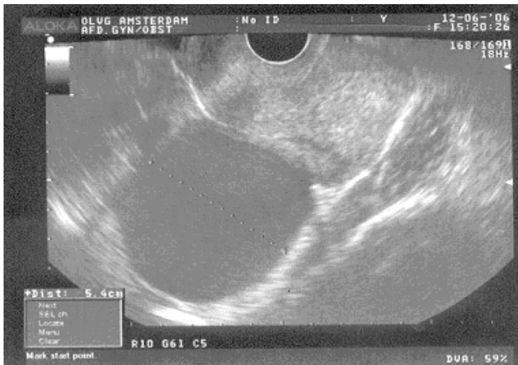
Figuur 2. Inwendige echoscopie bij endometriose: u ziet de eierstokken met endometriomen.