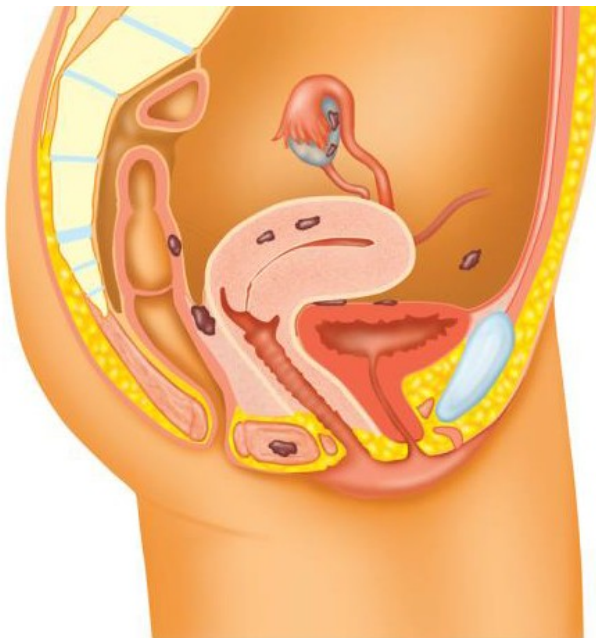
figuur 1a. zijaanzicht

Het slijmvlies in de baarmoeder wordt iedere maand dikker. Dit is de voorbereiding op een zwangerschap. Als u niet zwanger bent, breekt de slijmvlieslaag na ongeveer vier weken weer af en gaat bloeden. Het bloed komt met wat slijm naar buiten: dit is de menstruatie. De stukjes slijmvlies die buiten de baarmoederholte in de buik zitten, doen hetzelfde. Zij groeien iedere maand aan, breken af en gaan bloeden. Dit bloed kan echter niet naar buiten. Het komt terecht in de buikholte, in de eierstok of tussen de baarmoeder en de blaas of endeldarm. In de eierstok ontstaan soms een soort holten die gevuld zijn met (oud) bloed. Men noemt deze holten endometriomen. Tijdens en na de overgang stopt de groei en afstoting van het slijmvlies. Ook de stukjes buiten de baarmoeder groeien dan niet meer. Ze zitten er nog wel, maar geven meestal geen klachten meer. De endometriose is dan tot rust gekomen. (Zie figuur 1a zijaanzicht en figuur 1b vooraanzicht).