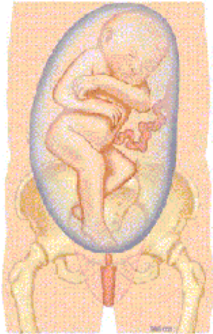
1d. Voetligging: benen gestrekt omlaag zodat een of beide voeten onder de billen ligt/liggen