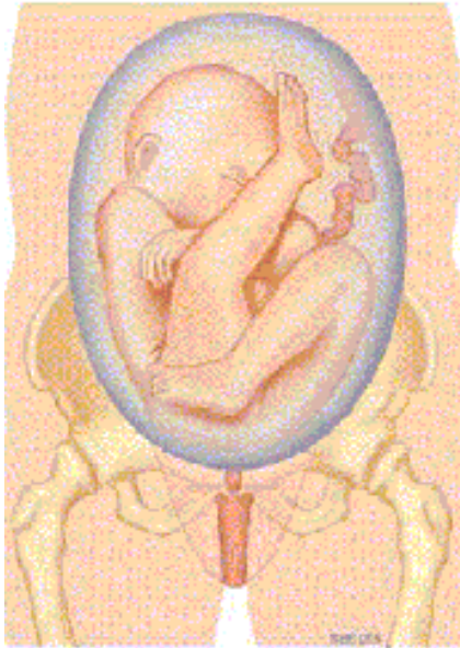
1c. Half (on)volkomen stuitligging: één been